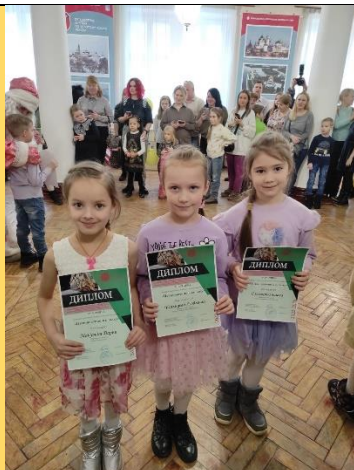
открытый районный конкурс детского творчества Путешествие в сказку