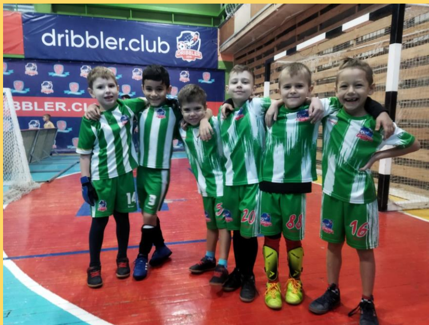
Команда по футболу Крохабол