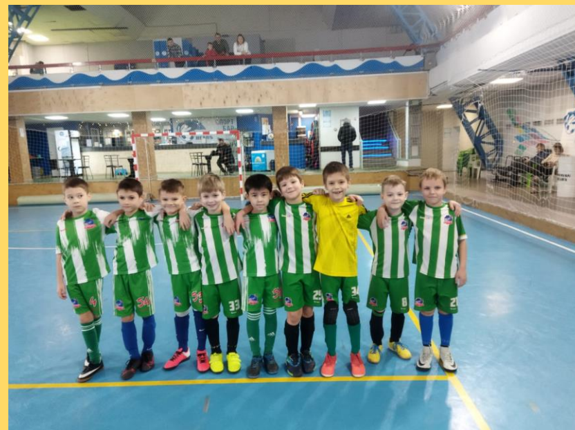
Постоянные призеры городских соревнований по футболу среди команд дошкольных учреждений Крохабол