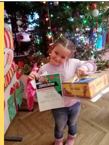
Лауреат I степени открытого районного акции-конкурса Теплый сквер в номинации Семейное дерево