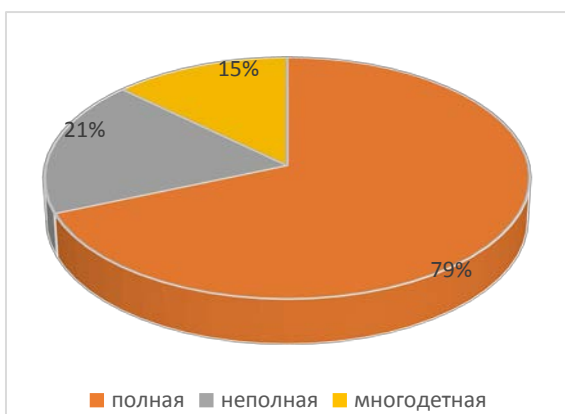
Состав семей воспитанников